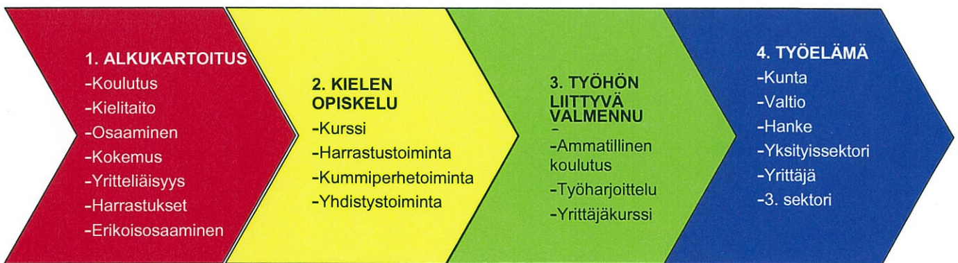
Kuvio 1. Maahanmuuttajan kotoutumisprosessi.

On syytä seurata tarkasti miten opiskelu etenee ja kuinka motivoitunut maahanmuuttaja on opiskelemaan. Lisäksi sopivatko hänelle käytetyt opetusmenetelmät. Sen mukaan voidaan tehdä muutoksia suunnitelmaan mahdollisimman aikaisessa vaiheessa.