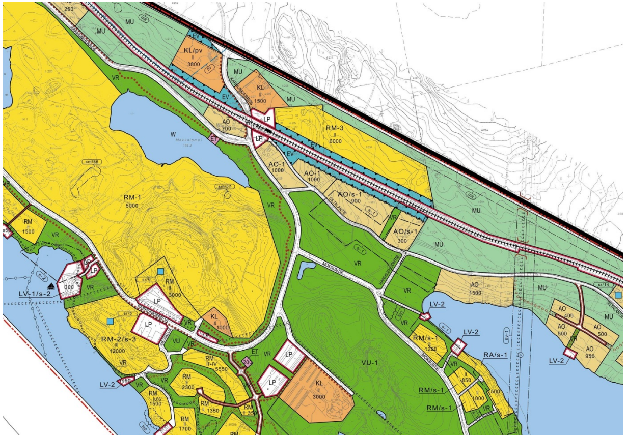
Kuva 2. Ote Moksunniemen osayleiskaavasta, KV 10.2.2014

Siltalantien ympäristöön on osoitettu alueen osa (s-1), jolla sijaitsee LsL 49 §:n perusteella suojeltuja liito-oravan lisääntymis- ja levähdyspaikkoja, joiden hävittäminen ja heikentäminen on kielletty.